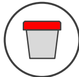
heces tomadas del recto